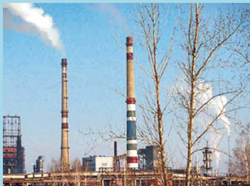
Омская ТЭЦ 4

Система управления выполнена на базе ПТК «Торнадо» и предназначена для автоматизации технологических процессов на котлоагрегате во всех эксплуатационных режимах. Автоматизацией охвачен полный состав функций контроля и управления. Объем системы составляет более 1600 каналов ввода/вывода.