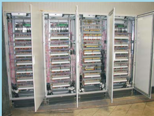
Шкафы Контроллеров Функциональных Узлов (вид сзади)

Микропроцессорную платформу ПТК системы составляют современные MIF-контроллеры, характеризующиеся высоким коэффициентом готовности и повышенной отказоустойчивостью. Технологические контроллеры