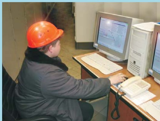
Дублированный АРМ машиниста

Система реализует полномасштабные функции контроля и управления котлоагрегатом: