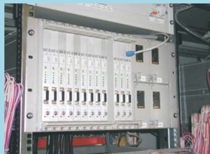
Крейт MIF-контроллера в шкафу КФУ

В качестве УСО используются функциональные submodule архитектуры ModPack, реализующие функции дискретного ввода/вывода, аналого-цифрового преобразования, фильтрации, цифро-аналогового преобразования и другие функции сопряжения с «полевым» уровнем. На каждый модуль-носитель MIF устанавливается до 3-х функциональных submodule ModPack.